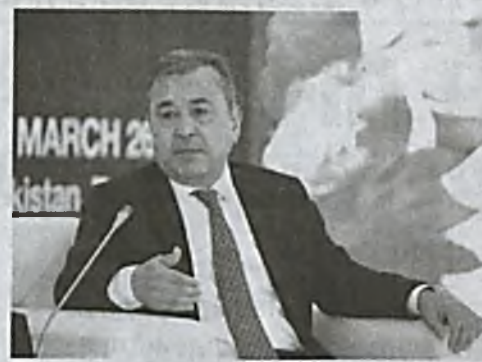
Соди́к САФОЕВ, первый заместитель Председателя Сената Олий Мажлиса Республики Узбекистан

— В настоящее время многие аналитики, политологи отмечают, что в Центральной Азии создана совершенно новая атмосфера. Реализуются межрегиональные программы, в том числе связанные с решением афганского конфликта. Предпринимаются совместные усилия по обеспечению мира и