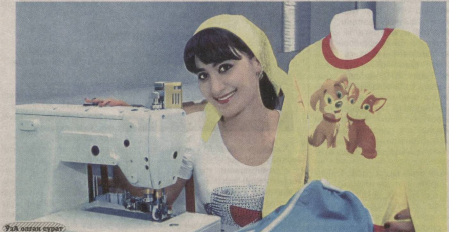
Ўзгача оғам сўроқ

Сайхунбод туманидаги "Сардор Текстиль Бизнес" хусусий корхонаси раҳбари