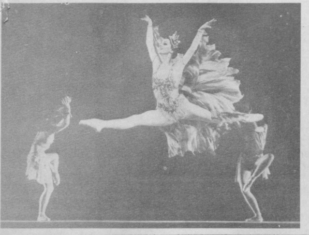
Москвалик Г. Соловьёв фотолари. («Тошкент оқшоми» учун).

Пойтахтимизда икки марта Ленин орденли СССР Иттифоқи Давлат академик Большой театрининг гастроллари катта муваффақият билан ўтмоқда.