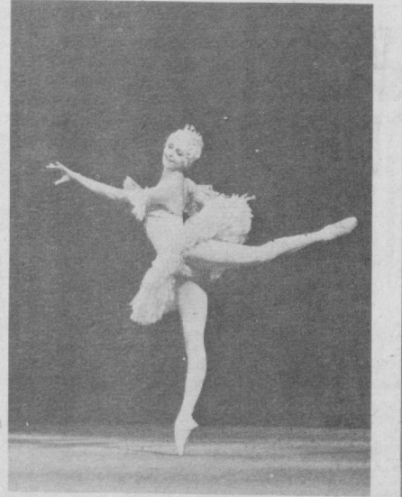
Москвалик Г. Соловьёв фотолари. («Тошкент оқшоми» учун).

Зиммамизга жуда катта масъулият ҳақи юклайди. Чунки совет санъатининг байроқдори бўлиш учун замонамизга ҳамоҳанг юксак санъатчи асарларини саҳналаштириш тақозо этилади.