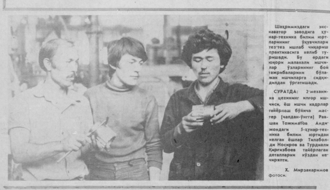
Шаҳримиздаги экс-каватор заводига ҳунар-техника билим юр-ларининг ўқувчилари тез-тез ишлаб чиқариш практикасига келиб туришади...

...ТАКЛИФ ЭТАДИ... МАХАЛЛА ОБОДОНЛАШМОҚДА