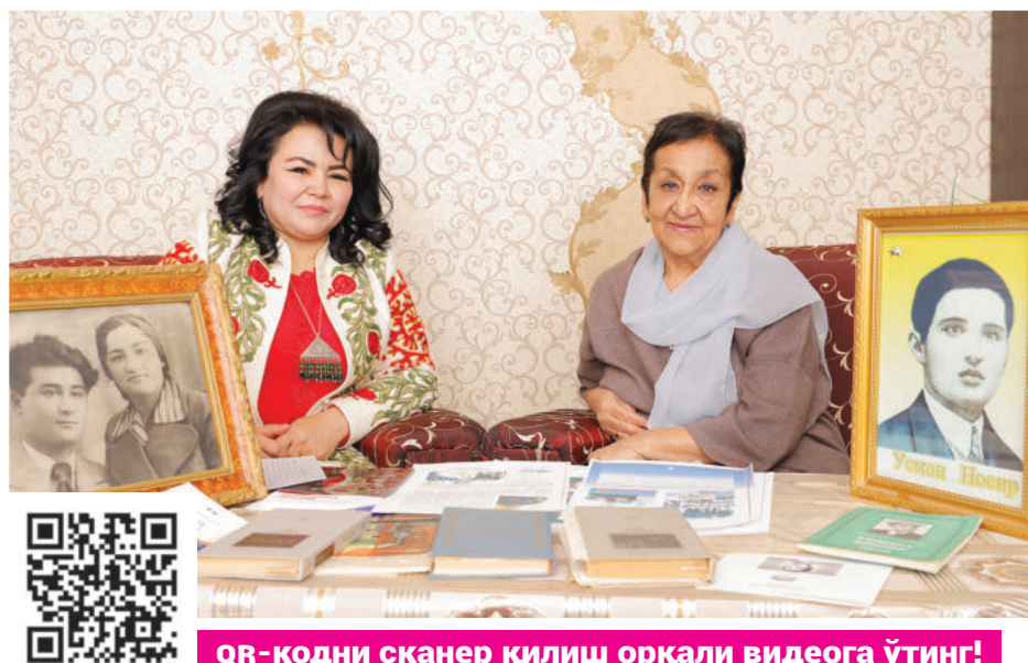
QR-кодни сканер қилиш орқали видеога ўтинг!