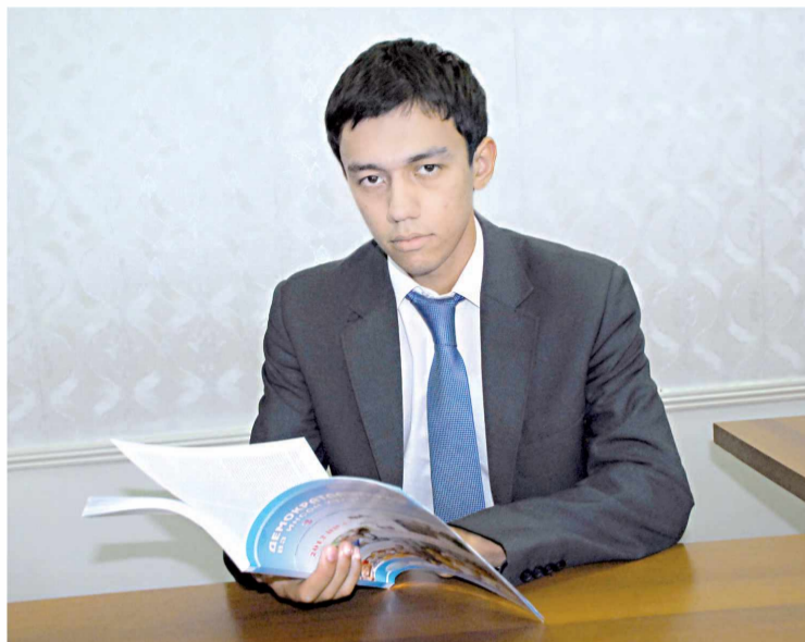
риж тажрибасига асосланиб «скоринг» тизимини жорий этиш кўзда тутилган. Бу жуда ҳам тўғри қарор деб ўйлай-

бу борада қабул қилинган қарорда ҳам кредит рискларини бошқариш бўйича хо-