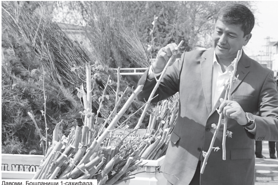
Давоми. Бошланиши 1-саҳифада.

«Яшил макон» умуммиллий ҳаракатнинг натижаси ҳар бир маҳаллада кўриниши керак, бу савобли ишни ҳавас билан бажариш керак»