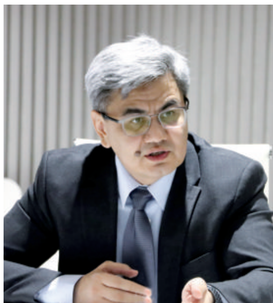
Обид ҲАКИМОВ, Ўзбекистон Республикаси Президенти Администрацияси хузуридаги Иқтисодий тадқиқотлар ва ислохотлар маркази директори

имкониятлари кенгайтирилади. Жорий ҳисобнинг таркибий тақчиллиги қисқартирилади. Янги технологиялар соҳасида салоҳиятини ошириш ва глобал рақобатбардошликка эришиш кўзда тутилган. Ёшлар орасида бандликни таъминлаш, шунингдек, ишчи кучи сифатини ошириш чоралари қўрилади. Бозорда турли механизмларни бирлаштириш учун мустақил бозор назорати институти ташкил этилади.