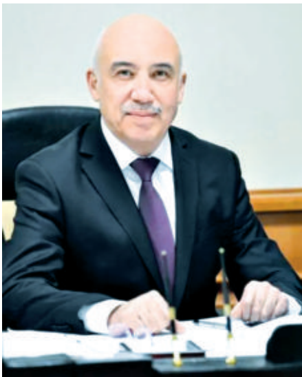
Алишер ШОДМОНОВ, Тошкент тиббиёт академияси ректори

Давлатимиз раҳбарининг бу йил 18 март куни тиббиёт ходимлари билан учрашуви Инсон кадрини улуғлаш ва фаол маҳалла йилидаги асосий мулоқотлардан бири бўлди. Юртимизда фуқаролар саломатлигига эътибор инсонни кадрлаш тамойилининг узвий қисмидир. Зотан, халқ соғлом ва баркамол бўлса, мамлакат ўз олдига қўйган юксак марраларга эриша олади. Бунинг учун миллий тиббиёт, соғлиқни сақлаш тизими фаолияти тўғрисида қўйилган бўлиши зарур.