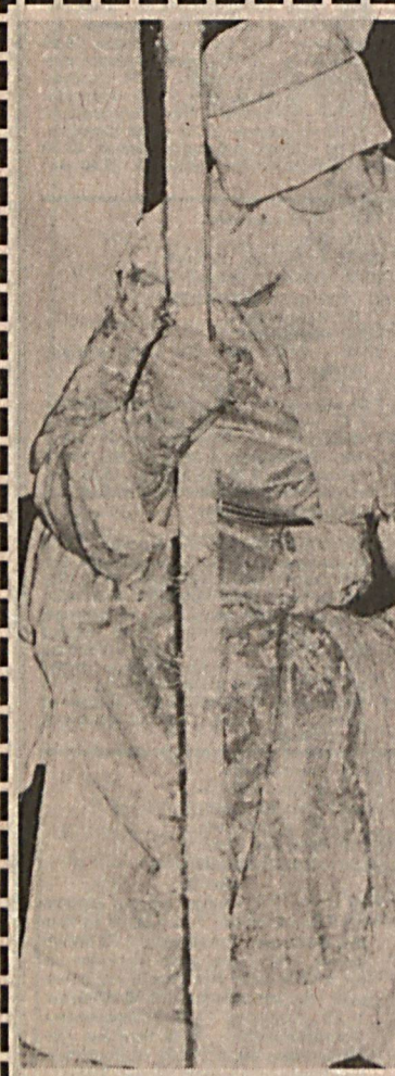
Қорбожон, Қорбожо Қўш келиннинг даврларига...