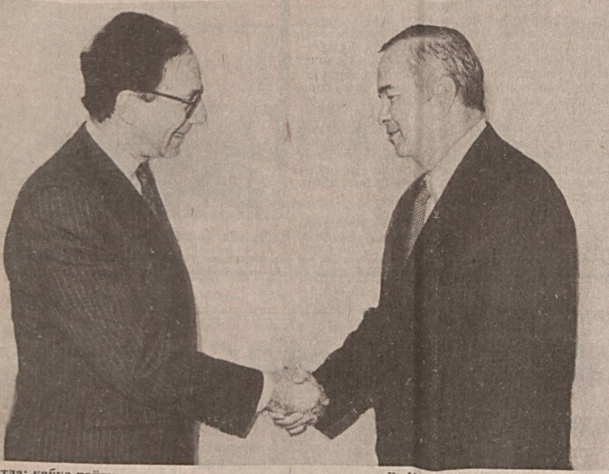
Суратда: қабул пайти.