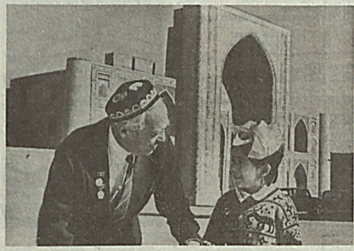
Бу — баландпарвоз сўзлар эмас, балки ҳаёт ҳақиқатидир. Сочлари қор каби ошмоқ, қон кечириб, жонини тиклаб бизни фашизм асоратидан асраб қолган уруш фахрийлари олдида биз бир умр қардоримиз.

Республикамиз Президентини Иккинчи жаҳон урушида қозонилган буюқ Галабанинг 51 йиллиги муносабати билан уруш фахрийларини рағбатлантириш ҳақидаги Фармонида имзо чекди.