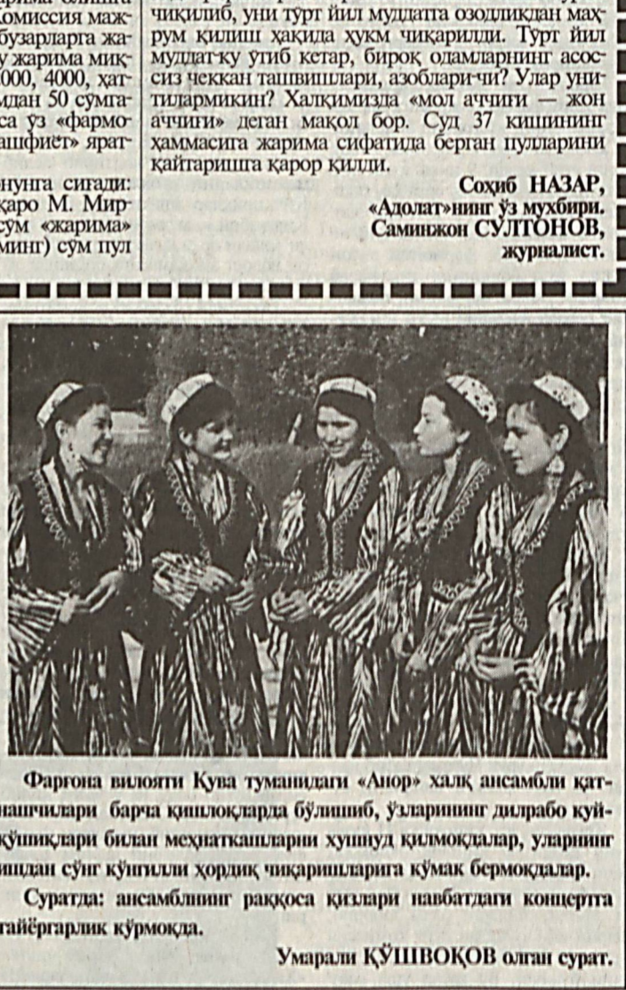
Фаргона вилояти Кува туманидаги «Аиор» халқ ансамбли қатнашчилари барча қишлоқларда бўлиб, ўзларнинг дилрабо куй-қўшиқлари билан меҳнатчиларни хушуд қилмоқдалар, уларнинг ишдан сўнг қўнғили ҳордиқ чикаришларига кўмак бермоқдалар.

Тошкент шаҳар Акмал Икромов туманидаги «Иерон» ҳуусейни фирмаси уз фаолиятини тухташганини маълум қилади.