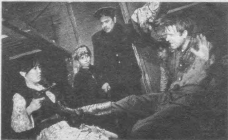
«Тошкент — нон шахри» филмидан.

Хўп деб, сўзларини ёдладим. Кейин вагонна-вагон юриб, кўрсата бошладик. Ассий ролларда ҳамширалар бўлиб, биргина эркак менман, 12-13 яшар бола. Бир вагонга кирганимиз-