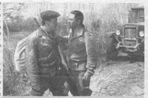
«Муҳаббат можароси» филмидан.

Москвада таҳсил олган экан. У киши гарчи врач бўлса-да, адабиётга жуда қизиқар, ҳикоялар, шеърлар ижод қиларди. Ҳатто Кўкон газетасида муҳаррир бўлиб ишлаган. Сўнг қорақўлчиликка ихтисослашган совхозга