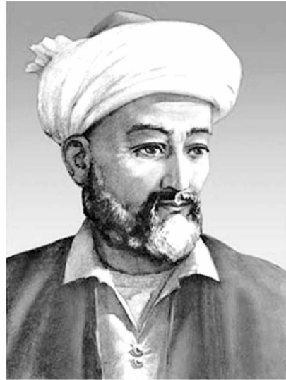
балки Мовароуннахрнинг энг машҳур табиблари ҳам тиб илми билан машғул бўлган. Бунинг учун уларга барча шароит ва имкониятлар яратилган. Бундан ташқари, муаррихлар Ҳиротдаги «Низомия», Марвадаги «Хусравия» мадрасаларини ҳам Алишер Навоий номи билан боғлашади.

Заҳириддин Муҳаммад Бобур мумтоз адабиётимизнинг тенгсиз намояндаси, фазал мулкининг султони Мир Алишер Навоийга шундай таъриф берган. Дарҳақиқат, бу нодир сиймо нафақат жаҳон адабиёти дурдоналарининг энг юксак намуналари қаторидан ўрин олган тақорланмас асарлар яратди, балки ўша даврда мамлакатдаги беқиёс бунёдкорлик ишларига бош-қош бўлди, ўз ҳисобидан масжиду мадрасалар, хонақоҳ ва шифохоналар қурдирди, кўплаб илм, ижод ва ҳунар аҳлига ҳомийлик қилди, бутун умрини оддий халқ мушуқлини осон қилиш, ҳаётини фаровон қилишдек эзгу мақсадга бахш этди.