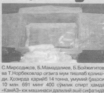
С.Мирсодиқов, Б.Мамадалиев, Б.Бойжигитов ва Т.Норбековлар озғига мум тишлаб қолиш-ди. Хозирда қарий 14 тонна, умумий баҳоси 10 млн. 691 минг 400 сўмлик спирт ҳамда «КамАЗ» юк машинаси далилий ашё сифатида олиб қўйилиб, «иқтирозчилар» устидан жиноят иши кўзғатилди.

маълумотларда маъкур туманининг Қозоғистон Республикаси билан чегарадош ҳудуддан катта миқдорда спирт маҳсулотлари олиб ўтилиши айтилганди. Шунга мувофиқ барча айланма йўллар назоратга олинди. «Карвон» узок кут-тирмади. Алишер Навоий жамоа «ўжалиги ҳудудда Тошкент шаҳри томон ҳаракатланаёт-ган «КамАЗ» русумли, 10 S 55-43 давлат рақамли юк машинаси департамент ходимла-рида бироз шубҳа тўғридандек бўлди. Б.Бой-жигитов бошқарувдаги юк машинаси тўхта-тилиб, юкюна кўздан кечирилди. Унинг орқаси-да бўзгагача ёғоч қипиқлари билан тўлдирил-ган халталар чиройли қилиб таҳданганди. Бир қарашда ҳаммаси рисоладагидек эди. Лекин халталар бирма-бир олинган, коса тағида ним-коса борлиги очик ойдин кўзга ташланиб қол-ди. Юкюнага махсус ўрнатилган турли ҳажм-даги цистерналарда 14 минг литр Қозоғистон-да ишлаб чиқарилган спирт жойланган экан. Машинанинг тағ қисмида махсус кранлар ўрна-тилган бўлиб, улар юкюнадаги цистерналарга уланган экан. Тегириқда бу «иқтироз» эгалари