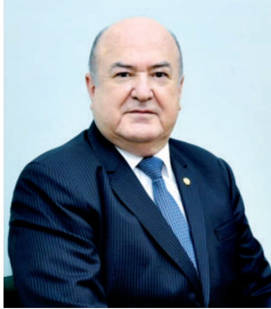
Қаландар АБДУРАҲМОНОВ, академик

Бу мусиқа оҳанги, адабиёт ва санъат сеҳри билан қалбни улғайтириш йўли бўлди.