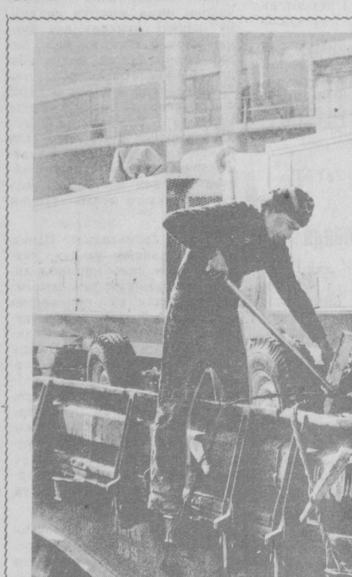
«Компрессор» заводининг маҳсулотлари мам- лкатимизнинг бир қанча шахарларида катта шўҳрат қозонган. Ундан қудратли индустрия-

— Менимча, 1988 йилда бунга эришол- масак керак. Аммо давлат корхонаси ҳа- қидаги қонун шартномаларни бузувчилар- ни асосий таличдан — яккаю-ягона ҳў- жайинликдан маҳрум этди. Одатда буюрт- мачи билан буюртмани бажарадиган кор- хоналар ўртасида алоқа ўрнатувчи воеита- чилар иттифоқимиз бўйлаб юришар, ўш ишларни ундирмагунча заводларда ўти- риб олишарди. Лекин маҳсулот етказиб берувчиларга бошқа нарса муҳим эди. Чунки, металлургияни олайлик. Улар- га бизнинг объект эмас, ўш планларини ба- жаршиш муҳим. Улар сурункасига бир хил навли металлари қўйишар, демек қолган буюртмаларни кейинроқ бажарса ҳам бў- лади, деб ўйлашарди. Эндики? «Ленинград- троблит» заводи ўш вақтида тюбинглар