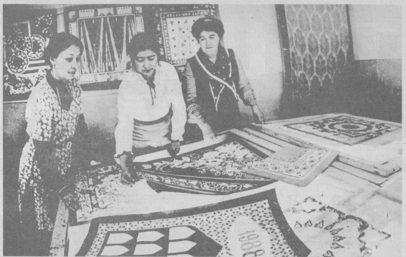
«Учкун» тўқимачилик-галантерея ишлаб чиқариш бирлашмаси коллективни эришайтган меҳнат ютуқларида корхона мўйқалам соҳибаларининг ҳам ҳиссаси салмоқли бўлмоқда. Улар ўзларининг дадил изланишлари билан маҳ- сулотларнинг янги турларини вужудга келтирмоқдалар.

Корхонанинг янгица ша- роитларида катта муваффа- қиятларга эришишига мод- дий ресурсларнинг бир ма- ромда етказиб берилмаётга- ни узоқ вақтгача салбий таъ- сир кўрсатиб келди. Коллек- тив бунинг чорасини топти. «Малика» трикотаж ишлаб чиқариш бирлашмасига на- лава етказиб берадиган Чита комбинати билан меҳнат ҳамкорлиги тўғрисида шарт- нома тузилди. Ҳар икки кол- лективнинг бир-бири билан яқин узвий алоқада бўлиши ҳўжалик ҳисоби шароитида маҳсулотларнинг харидор- ги бўлишига, модали маҳ- сулотлар ишлаб чиқаришни кўпайтиришга ёрдам бермоқ- да. Турдош корхоналар ўр- тасидаги муособақа камчили- гини ўш вақтида аниқлашга ва энг муҳими, маҳсулотлар сифатини тубдан яхшилашга ижобий таъсир кўрсатмоқда.