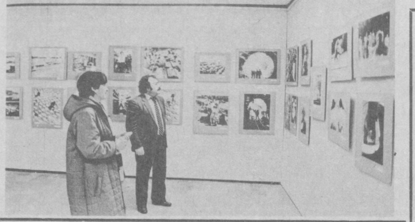
ЎЗБЕКISTОН ССР ЕЗУВЧИЛАР СОЮЗИДА «ОҚ ҚУШЛАР, ОПОҚ ҚУШЛАР»

Бекобод районидидаги «Победа» колхози маданият саройида ўтказилган китобхонлар конференциясини тинчлик мавзусига бағишланди.