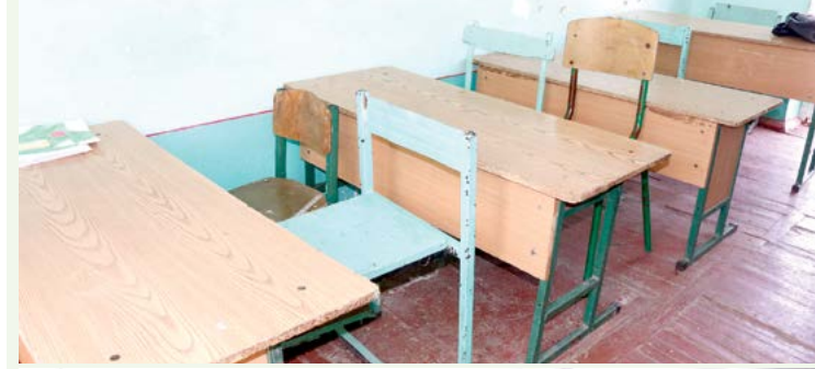
Жамшид ЭРГАШЕВ, «ISHONCH»

– Кўриб турибсиз, мактабда ўқувчилар учун ҳам, ўқитувчилар учун ҳам шароит йўқ. Хоналар етишмайди. Шу сабаб туман ва вилоят ҳокимликла-