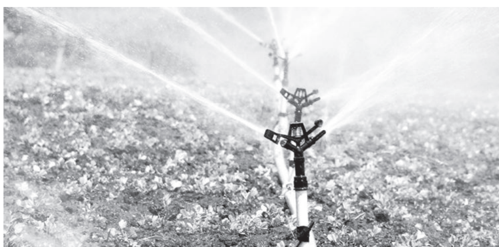
«Окончание. Начало на 1-й стр.»

Однако пандемия, глобальное изменение климата, дефицит воды и геополитическая ситуация, ставшие испытанием для всего мира в последние годы, требуют ускорения исследований в этой области, широкого использования ресурсосберегающих технологий для поддержания цен на продовольствие, мобилизации всех имеющихся возможностей.