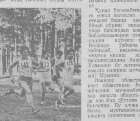
СУРАТЛАРДА: Иванонодаги ўрта хунар-техника билим юртиларида ўқитган ёшлар ҳаётидан лавҳалар.

Хунар ўрганаётган ёшларга сопол лагеллар, қозонлар етказиб бериш ҳақида ҳам ўйлаб қўриш керак. Чунки улар бизлардан ана шу асбоб-анжомларни етказиб беришни илтимос қилишди.