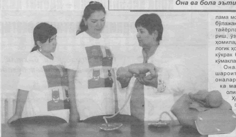
Она ва бола эътиборда

Икки олам орасида туриб, дунёга келаётган чақалоғининг соғ-омон туғилиши учун ўз жонидан ҳам кечишга тайёр она. Унинг ёнида далда бўлиб, тўлғоқ дардини ўз дардидек қабул қилиб, икки вужуд, икки руҳ она ва болани ёруғ оламга чорлаётган шифокор. Машаққатли, масъулиятли, нурли лаҳзалар.