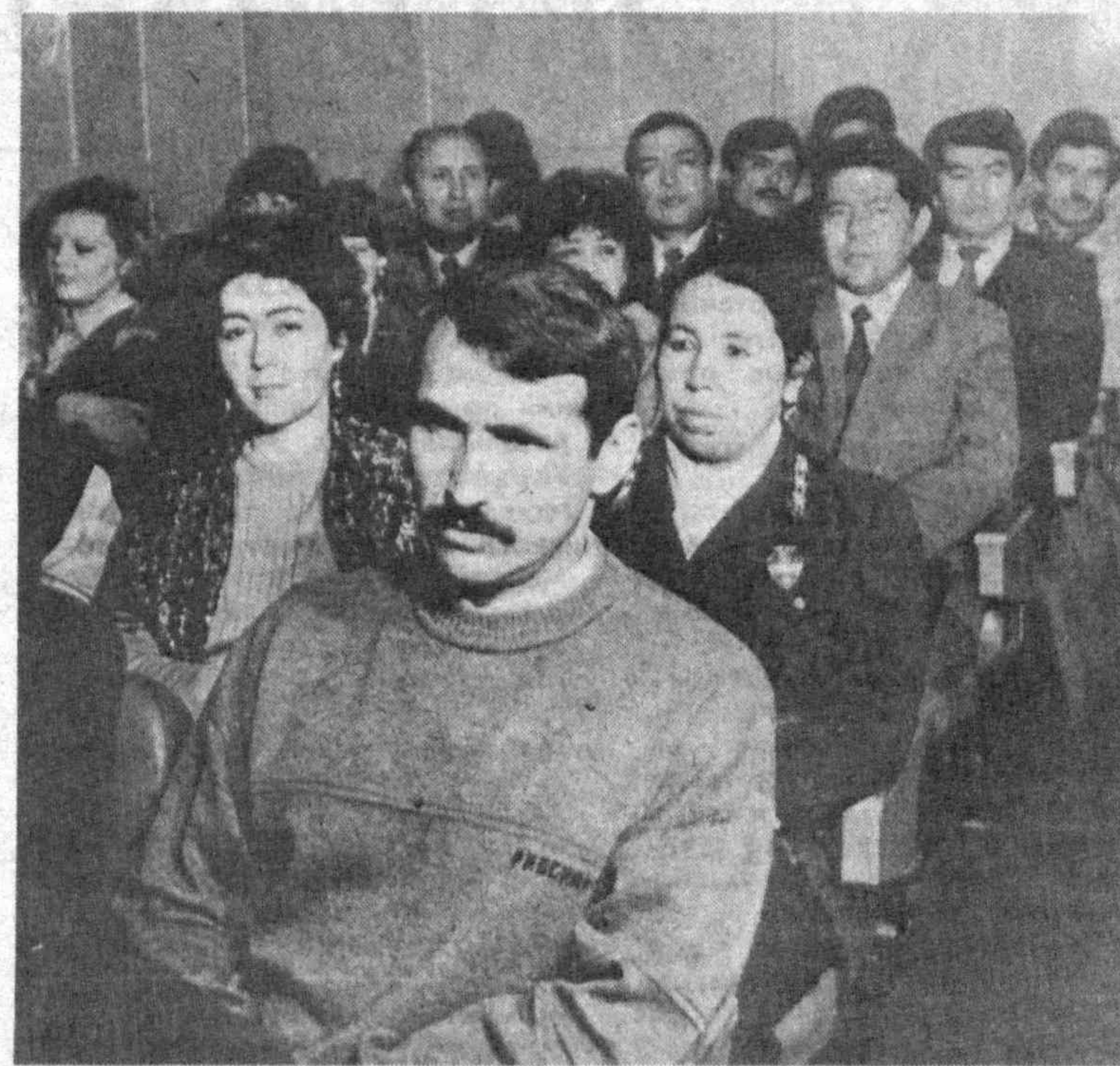
На снимках: на собрании актива.