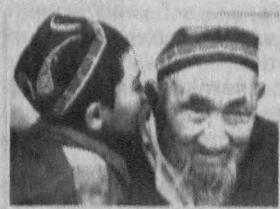
— Яна нима дейди? — Бир қалам чархлаб кўринг-чи, — дейди.

Номинациялар бўйича голибларнинг ҳар бири 250 миғ сўмдан пул муқофоти билан тақдирланади.