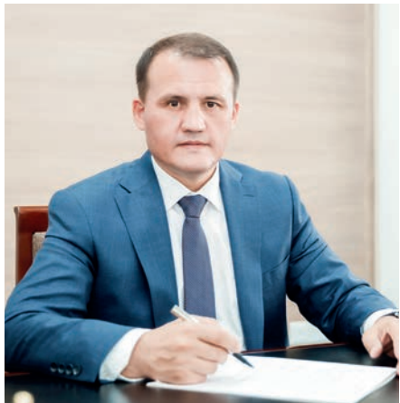
Ахтам ХАЙТОВ, Олий Мажлис Қонунчилик палатаси Спикери ўринбосари, O'zLiDeP фракцияси раҳбари

Бир неча кун аввал кучга кирган қонун соҳанинг ҳуқуқий асосларини такомиллаштириш орқали мавжуд салоҳиятдан унумли, оқилна фойдаланиш имконини беради. Шу ўринда қонунда белгиланган нормалар нималарга хизмат қилишини батафсилроқ баён қилиш мақсадга мувофиқ. Қонун, аввало, органик маҳсулотлар ва хомашё ишлаб чиқариш тизимидаги муносабатларни тартибга солиш ҳамда соҳа фаолиятини ривожлантиришнинг ҳуқуқий асоси яратилишига имкон беради. Иккинчидан, аграр ишлаб чиқаришда бозор муносабатларини ташкил этишнинг ишончли ва истиқболли шакли ҳисобланган органик маҳсулотлар ва хомашё ишлаб чиқариш тизимининг янада ривожланишига йўл очади. Учинчидан, органик маҳсулотлар ва хомашё ишлаб чиқариш тизимида тадбиркорлик фаолияти, шу жумладан, ишлаб чиқарувчидан якуний истеъмолчигача бўлган тизим такомиллашади. Тўртинчидан, ҳудудларнинг экспорт салоҳиятини ва географияси кенгайтиши билан бир қаторда фермер хўжаликлари ҳамда аҳоли даромади ошади. Бешинчидан, юқори сифатли экологик тоза маҳсулотлар ишлаб чиқарилиш ҳажми ортиб, натижада атроф-муҳит, инсонлар саломатлигига салбий таъсирлар камаюди. Энг муҳими, органик маҳсулотлар етиштиришнинг асосий принциплари, давлат томонидан тартибга солиш қоидалари, қўллаб-қувватлаш, ишлаб чиқарувчиларнинг ҳуқуқ ва мажбуриятлари, фаолияти кафолатлари ўз аксини топган мазкур қонун жаҳон бозорига мамлакатимизнинг муносиб ўринга эга бўлиши, халқимиз фаровонлиги юксалишига хизмат қилади.