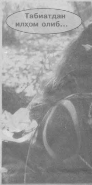
Табиатдан илҳом олиб...