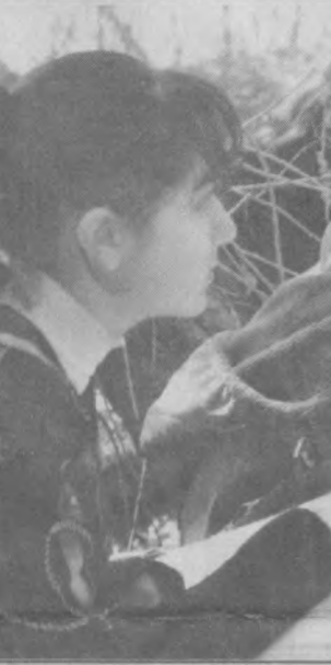
X.ATOEV olgan surat - lavha.