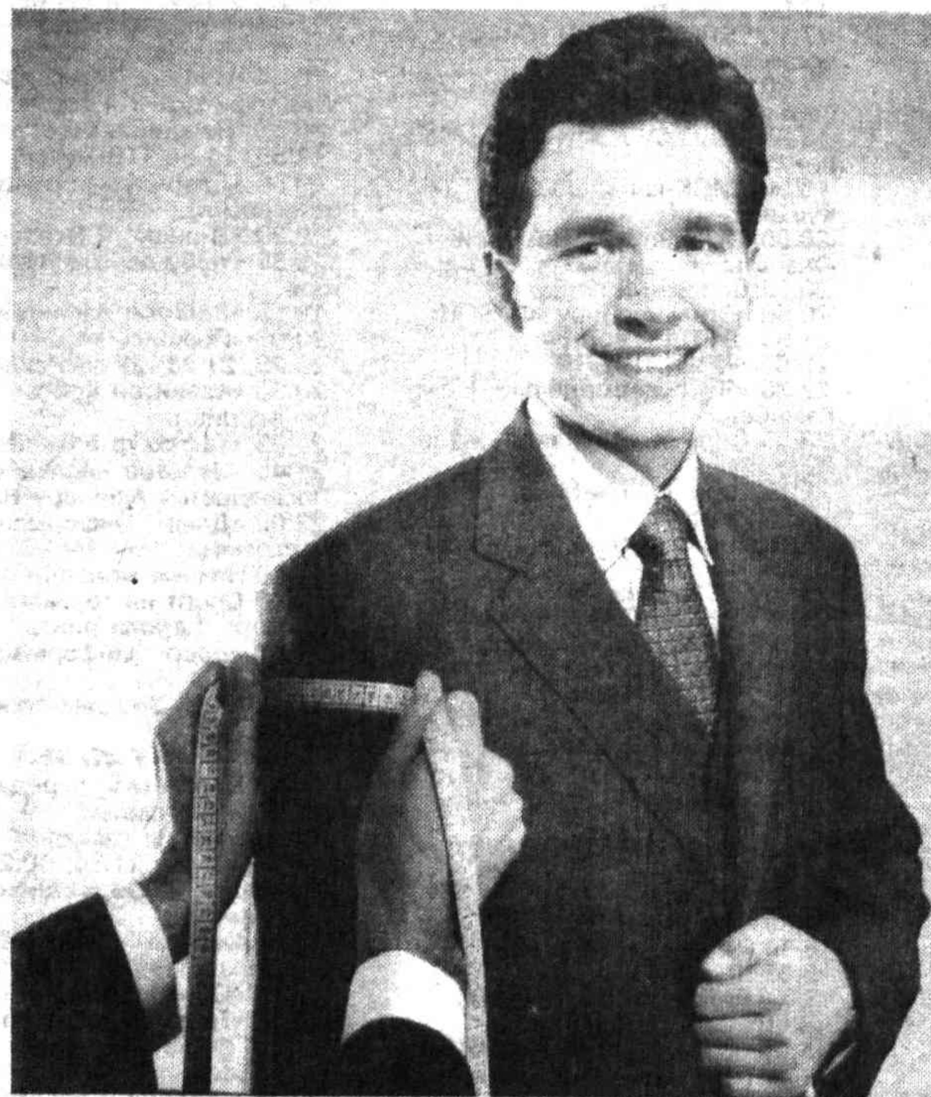
В столичной области все больше тех, кто свою жизнь, свою судьбу связывает с организацией собственного дела, развитием предпринимательства. В то же время в деле развития бизнеса еще немало неиспользованных возможностей

субъектов малого и среднего бизнеса в 2000 году появилось почти на тысячу больше, чем в году позапрошлом.