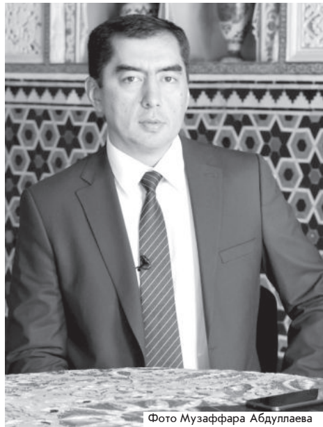
«Окончание. Начало на 1-й стр.»

В стране под государственной охраной 8210 объектов материального и культурного наследия, из которых 4788 - археологические, 2265 - архитектурные объекты, 625 - монументальные произведения искусства, 530 - достопримечательности.