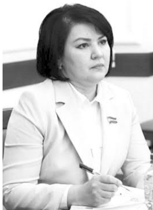
Зухра ШАДИЕВА, Олий Мажлис Қонунчилик палатаси депутаты, ЎзХДП фракцияси аъзоси:

— Куни кеча муҳим воқеа — фуқаролар йиғинлари раиси (оқсоқоли) сайлови бошланди. Худудларда жараёнга тайёргарлик кизгин ўтди. Номзодлар ҳам, аҳоли вакиллари ҳам бирдек ҳаяжон ва масъулият билан сайлов кунини кутишганди.