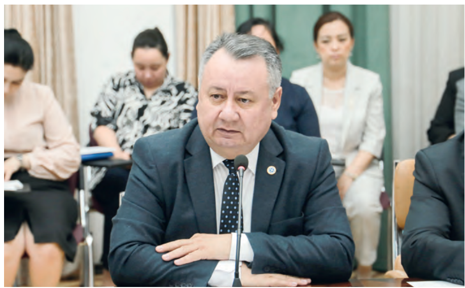
Шухрат БАҒАЕВ, Олий Мажлис Қонунчилик палатаси депутати, О'zLiDeP фракцияси аъзоси:

Шулардан келиб чиққан ҳолда, йиғилиш қарорига мувофиқ О'zLiDeP фракцияси конституциявий ислохотларни бошлаш масаласини Олий Мажлис палаталари кенгашларининг қўшма мажлисига киритишни яқдиллик билан қўллаб-қувватлайди.