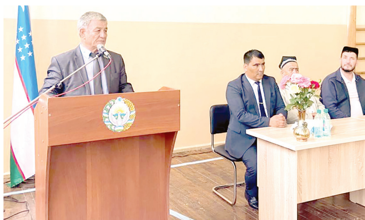
сайловчилар яширин овоз бериш йўли билан ўзлари