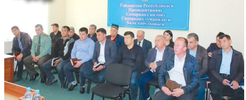
Халқ билан мулоқот