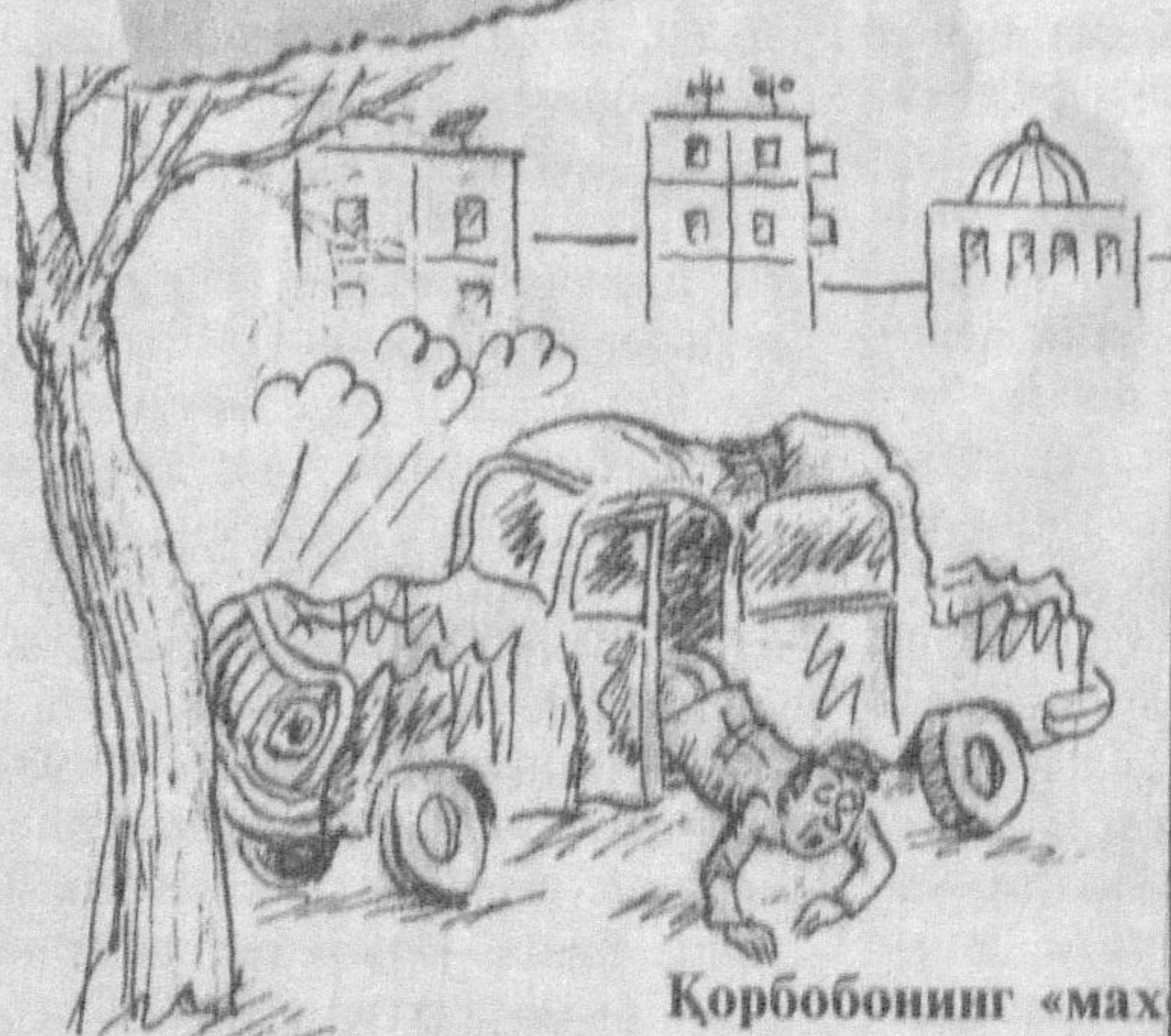
Қорбоннинг «маҳсу» совғаси.

-Сиз ўртоғингизни ётоқ билан ургангизми тан оласизми? -Оламан. -Хўш, жазони қишатиш учун нима дея оласиз? -Мен уни юмшоқ ётоқ билан урдим.