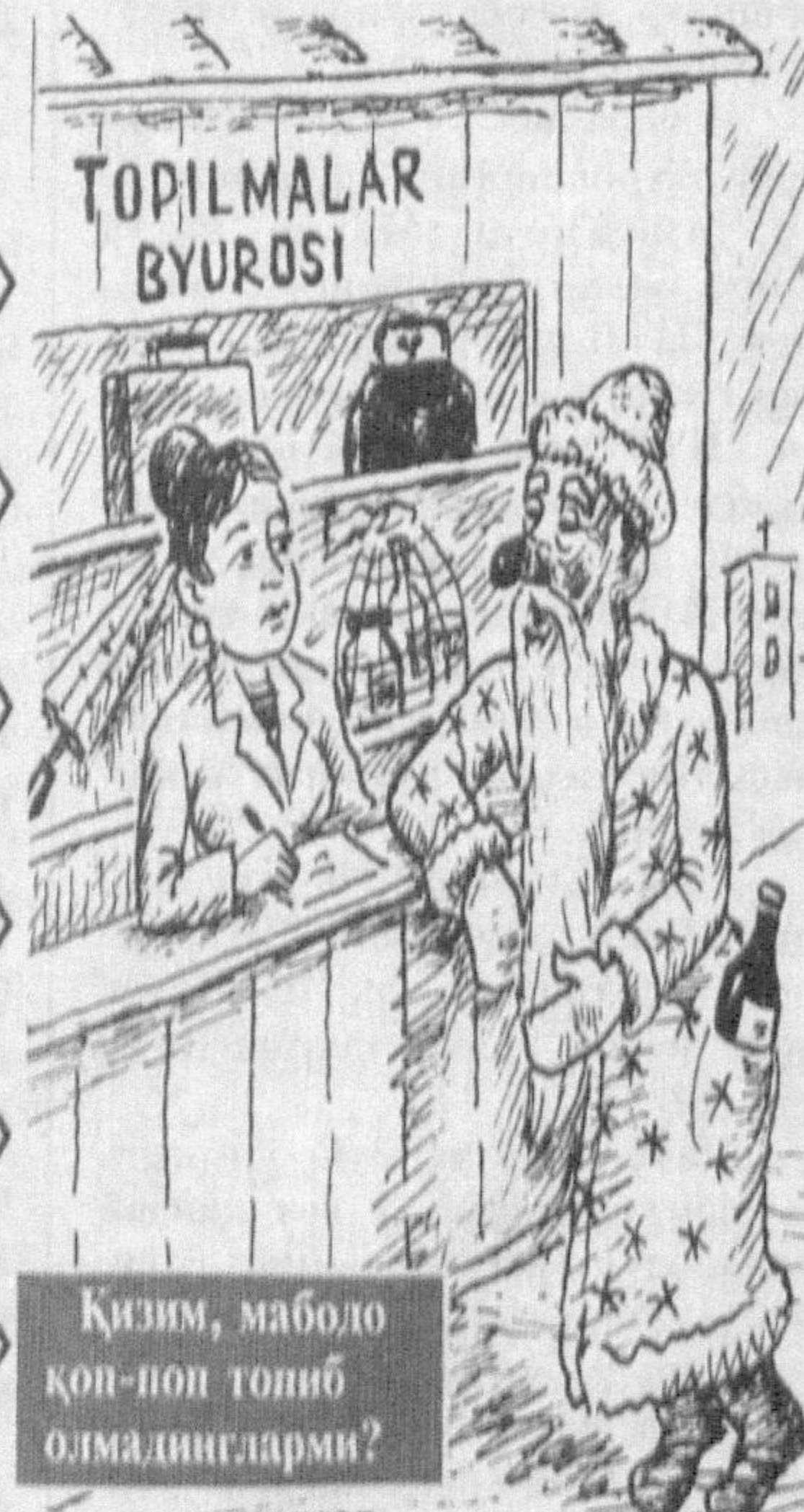
Қизим, маболо қоп-поп толиб олмадингларми?