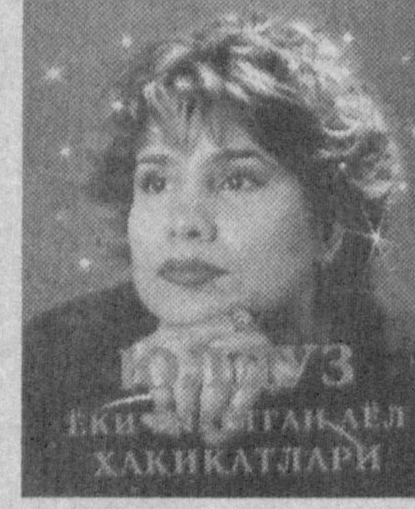
Бизнинг айтган аёл ҲАҚИҚАТЛАРИ

Санъаткор борки, ҳаммаша эл кўзида, эътиборда. Уларнинг ҳаёт тарзи, одатларига муҳлислар жуда қизиққандилар. Лекин уларни ўйла-тираётган муаммолар, ташвишлар-га ҳам қизиқамизми? Айниқса, санъаткорнинг санъат ҳақидаги фикрларига биз қўшила оламизми?