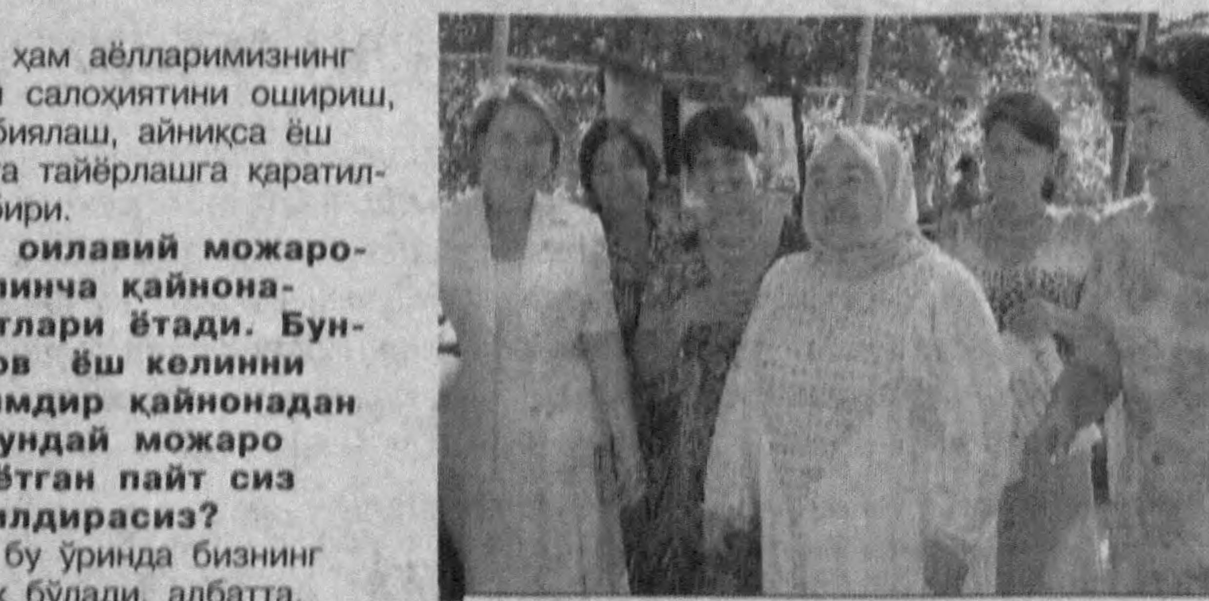
Маҳалланиннг фаол аёллари байрам арафасида

ташкил этилган. Бу ҳам аёлларимизнинг маънавий-ижтимоий салоҳиятини ошириш, ёшларни тўғри тарбиялаш, айнақса эҳ қизларимизни ҳаётга тайёрлашга қаратилган тадбирлардан бири. — Маълумки, оилавий можаролар асосида кўпинча қайнона-келини муносабатлари ётади. Бундай пайтда биров ёш келинини айбласа, яна кимдир қайнонадан гина қилади. Шундай можаро муҳокама этилаётган пайт сиз қандай фикр билдирасиз? — Ёш келинчақ бу ўринда бизнинг кўмагимизга муҳтож бўлади, албатта. Негаки, ёш келини осилоби бир ниҳол, янги хонадонда идиш этиб олгунча қайнона уни ширин сўз, тарбия билан парваришлаши лозим. Бу ишни қайноначилик ҳеч қачон эгилмайди. Баъзида арзимас бахона можарога сабаб бўлади. Келин тумани мазаби тайёрлай бўлмас эмиш. Шунда қайнонага секин шилшайман: "Ўғратинг, вазимлик билан тушуниринг". "Ҳо, нега мен ўргатаман, қиз ўстирган онаси ўргатсин эди!" Бундай муносабат ёш оилга дарз тўшириши ҳеч гап эмас. Бу гаплар турмушининг майданга жихатлари бўлиб қуринадан, оила мустаҳкамлигига олоқдор бўлгани учун жамиятимиз ҳаётида аҳамиятлидир. Шу боис қизларимизни оилавий ҳаётга тарбиялаш масаласига жиддий ёндашишимиз даркор. Қолаверса, турмуш фақат таом пиширишдан иборат эмас, ёш