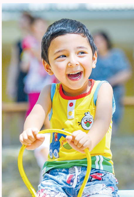
1 июнь – Халқроқ болаларни ҳимоя қилиш кунини

Тадбир Жиззах шаҳридаги Шароф Рашидов ва ўзбек адабиётининг икки буюк қалб эгаси Ҳамид Олимжон ҳамда Зулфияхоним ҳайкаллари пойига гул қўйиш ва уларнинг хотирасини ёд этиш билан бошланди. Зардўзлик, каштачилик, хунармандчилик намуналаридан ташкил топган кўргазма ва Жиззах миллий либослари, Фориш туманидаги “Боғдон гуллари” фольклор этнографик халқ ансамбли аъзоларининг чиқишлари намойиш этилди.