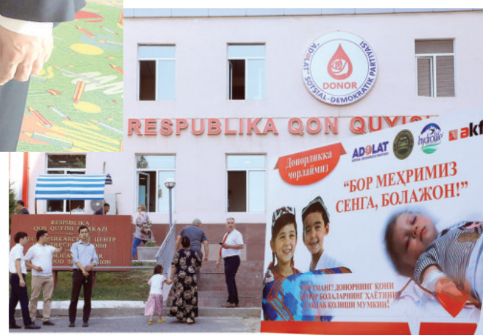
Партия ташаббуси билан ҳар йили анъанавий равишда 1 июнь – Халқаро болаларни ҳимоя қилиш куни ва 3 декабр – Халқаро ногиронларни ҳимоя қилиш

қунида ўтказиладиган хайрия акцияси тиббий-ижтимоий ёрдамга муҳтож болаларни қўллаб-қувватлаш, бемор болалар ҳаётини сақлаб қолиш, шунингдек, жамиятда инсонпарварлик ва меҳр-оқибат ғояларини тарғиб қилишга қаратилган.