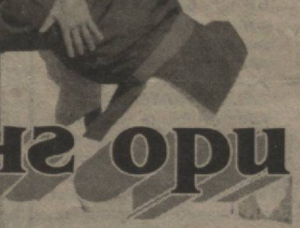
шундай қулочкашлаб, қисиб ушлаб, ўз тепасига баравар қилиб, кейин шундай гурсиллатиб ерга ташладики, айримлар буни сезмай ҳам қолишди. Шунда бойсунликлар даврага чиқиб, уйнаб кетишди. Полвонни қўтариб, майдонни уч-тўрт марта айлантиришди.

Ҳалиги рақиб полвон даврани икки марта айланди. Пирим эса майдоннинг қоқ ўртасида тураверди. Одатда, биринчи ушлашганда саломлашиб, қўйиб юборилади. Аммо Пирим рақибини