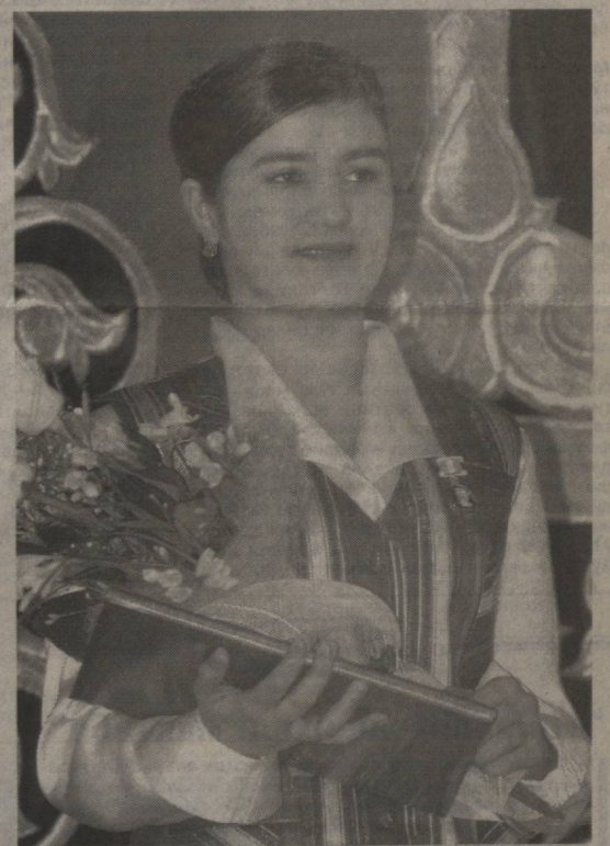
Фармонга мувофиқ, Қора- қалпоғистон Республикаси, вилоятлар ва Тошкент шаҳри- даги барча ўзини-ўзи бош- қарши органларида диний маърифат ва маънавий-ахло- қий руҳида тарбиялаш, уларни турли зарарли оқим- лар таъсиридан асрашда мас- лахатчи аёлларнинг ҳам му- носиб хиссаси бор. (Давоми 2-бетда)

Ўзбекистон Республикаси Бош вазирининг ўринбосари, Республика Хотин-қизлар қўмитаси раиси С.Иномова мамлакатимизда давлат ва жамият қурилишида хотин- қизлар фаолигини янада ошириш, ижтимоий-ҳуқуқий жихатдан қўллаб-қувватлаш, қасбий, жисмоний, маънавий ва интеллектуал савиясини юксалтириш, оила, оналик ва болалик манфаатларини ҳимоялаш бўйича бетиқсол ишлар амалга оширилаётган- ини таъкидлади. Бу борада Президентимиз Ислом Қаримовнинг 2004 йил 25 майда қабул қилинган «Ўзе- бекистон Хотин-қизлар қўми- таси фаолиятини қўллаб-қув- ватлаш борасидаги қўшимча чора-тадбирлар тўғрисида»ги Фармони дастуриамал бўлиб хизмат қилмоқда.