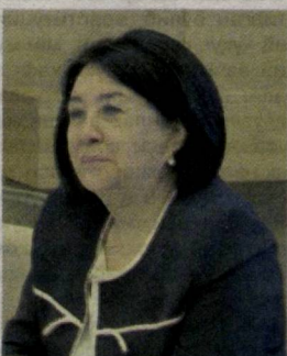
Робаксон МАҲМУДОВА, Олий суд раиси биринчи ўринбосари

Давлатимиз раҳбари Шавкат Мирзиёевнинг ташаббуси билан мамлакатимизда сўнгги беш йилда суд-ҳуқуқ тизимини тубдан ислох этишга қаратилган кенг қамровли ташкилий-ҳуқуқий чора-тадбирлар амалга оширилди.