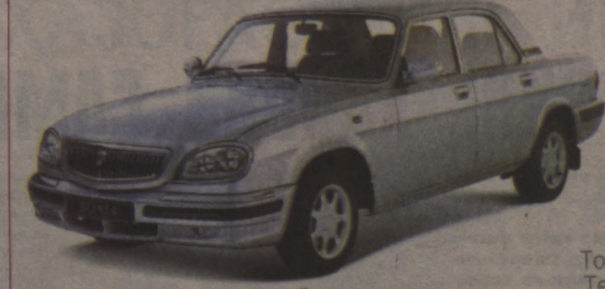
Шунингдек, сотувда "ВАХТАВЫЙ" автомобиллари ҳам мавжуд.

AVTODOM PLUS "VAZ" РУСТИМНИНГ РАСМИЙ ДИЛЕРИ WWW.AUTO.UZ