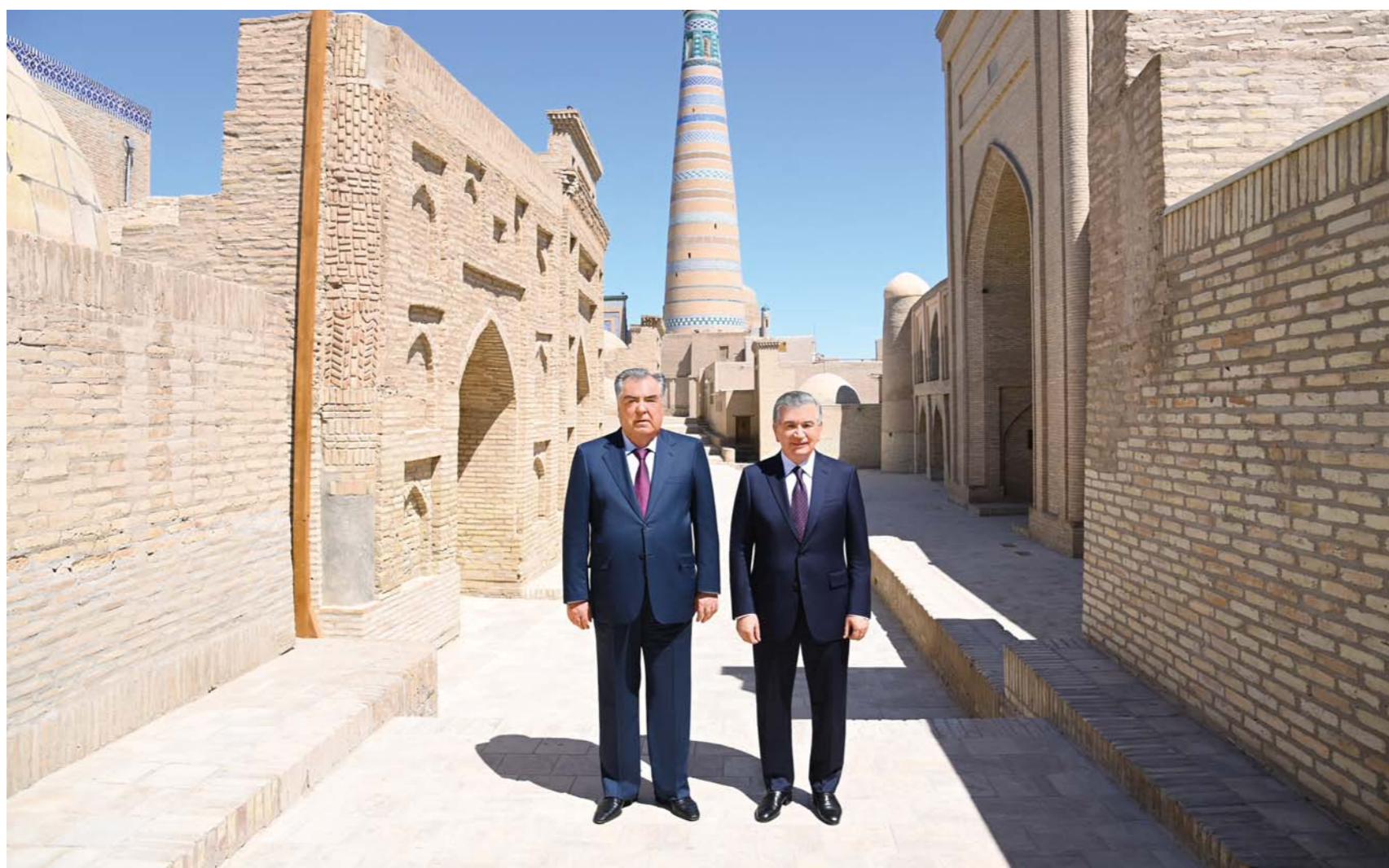
Бо даъвати Президенти Ҷумҳурии Ўзбекистон Шавкат Мирзиёев Президенти Ҷумҳурии Тоҷикистон Эмомалӣ Раҳмон 2 июн бо боздиди расмӣ ба кишвари мо омад

Халқҳои ўзбек ва тоҷик дар тўли асрҳо ҳамсояи наздик буда, онҳоро риштаҳои дўстӣ ва хешутаборӣ ба ҳам мепайванданд. Ба ҳам пайвастани маънавиёт, адабиёт, мусиқӣ ва тарзи зиндагии ду халқ як падидаи беназири таърих аст. Дар душвортарин давраҳои таърихӣ ҳамдигарро дастгирӣ мекарданд, паҳлӯ ба паҳлӯ меистоданд. Онҳоро таърих, дин, фарҳанг ва анъанаҳои муштарақ муттаҳид мекунанд.