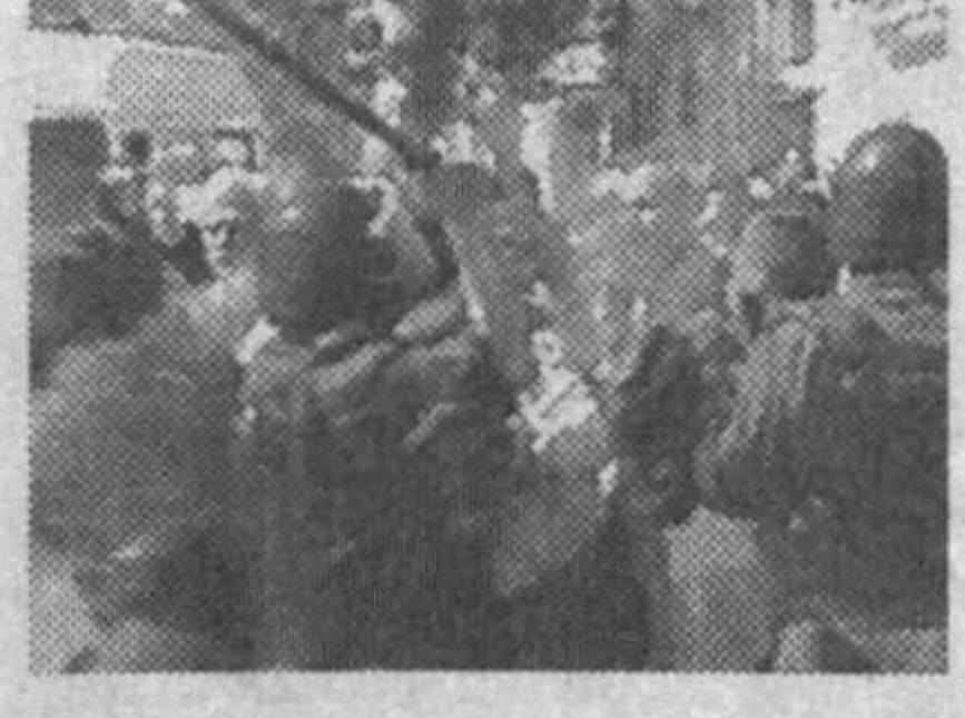
Йил ёзда Ливаннинг «Хизбаллох» гуруҳи қарши урушдаги муваффақиятсизлик учун масъулиятни ўз зиммасига олиб, лавозимидан кетганди.

Исроилдаги мухолифатчилар мамлакат бош вазири Эхуд Ольмерт ва мудофаа вазири Амир Перецнинг истеъфога чиқишини талаб қилишмоқда.