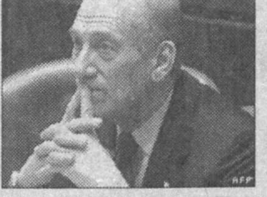
Уларнинг фикрича, Бушнинг Ироққа нисбатан олиб бораётган сиёсати мамлакат

АҚШ Конгрессининг кўзга кўринган уч нафар сенатори Ироққа яна қўшимча 20 минг нафар ҳарбийнинг жўнатилишига қарши резолюция қабул қилинганини эълон қилди.