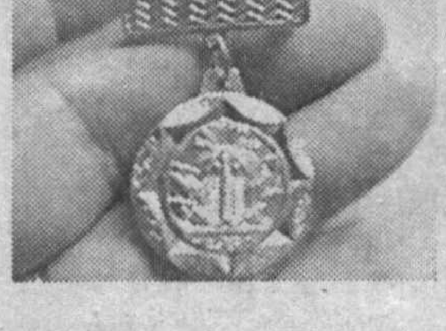
Йоханнесбургдаги музейда Садам Хусайнга тегишли медаллар коллекцияси намойиш қилинмоқда.

АҚШ ва Европанинг катта ҳудудларида кучли довул ҳужуми сурмоқда. Сунгги маълумотларга қараганда, АҚШда қишнинг ҳаддан ташқари совуқ ва ноқулай келиши тўғрисида 55 киши ҳалок бўлди.