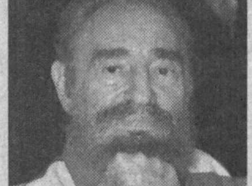
Испаниялик жарроҳ Хосе Луис Гарсиа Сабрида Фидель Кастронинг аҳоли оғир деган маълумотини рад этди.

Йоханнесбургдаги музейда Садам Хусайнга тегишли медаллар коллекцияси намойиш қилинмоқда.