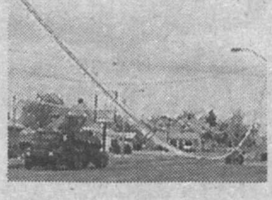
Метеорология хизматларидан олинган маълумотларга кўра, Европанинг шимоли-ғарбий қисмига кучли довул яқинлашиб келмоқда.

Озарбойжонда ўнга яқин киши давлат тўнтаришига тайёргарлик кўраётганлигида гумон қилиниб, ҳибсга олинди.