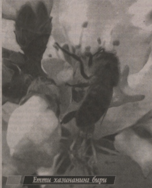
Етти хазинанинг бири

Дарҳақиқат, асал фақатгина дастурхонимиз кўрки бўлиб қолмасдан, кўплаб дардлардан фориғ бўлишимизга кўмаклашади. Асалари жуда меҳнатқаш жонивор. Унда синоат кўп. Шунданми, гузорлик тадбиркор Эргаш Ботировнинг ишчи асаларичиликка тушди.