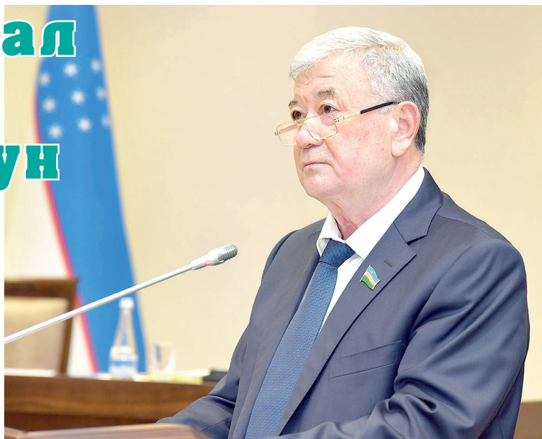
Кутубиддин БУРХООНОВ, Олий Мажлис Сенатининг Мудофаа ва хавфсизлик масалалари қўмитаси раиси

Мамлакатимиз Конституциясига ўзгартириш ва қўшимчалар киритиш бўйича таклифлар бериш жараёни тобора қизгин тус олмақда. Жамиятимизда ўзига хос фаол ижтимоий-сиёсий муҳит юзага келди.