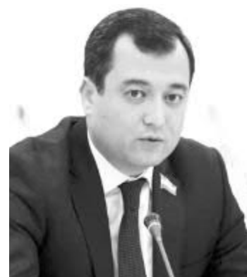
Шербек БҮРОНОВ, Олий Мажлис Қонунчилик палатаси депутати, ЎЗХДП фракцияси ва Коррупцияга қарши курашиш ва суд-ҳуқуқ масалалари кўмитаси аъзоси:

— Демократик жамиятда адвокатлар ҳуқуқи, уларнинг эмин-эркин фаолияти кафолатланган бўлади. Чунки фуқароларнинг устувор ҳуқуқ ва эркинликлари таъминланиши айна соҳа вакилларининг ҳурмати жойида бўлишига ҳам боғлиқ.