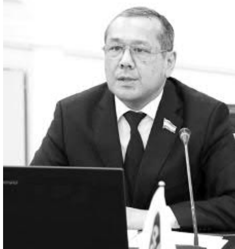
Улуғбек ИНОЯТОВ, Олий Мажлис Қонунчилик палатасидаги Ўзбекистон ХДП фракцияси раҳбари, Конституциявий комиссия аъзоси:

— Конституциямизга таклиф-мулоҳазалар билдириш жараёни кизгин давом этаётганини кузатиб, янги даврдаги ислохотлар натижасида халқ билан давлат ўртасида мулоқотнинг янги даражаси вужудга келганини ишонч билан таъкидлаш мумкин.