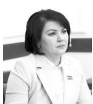
Зухра ШАДИЕВА, Олий Мажлис Қонунчилик палатаси депутати, Ўзбекистон ХДП фракцияси аъзоси:

Ҳар бир киритилаётган ўзгартиришлар пишиқ-пухта, ҳар томонлама ўйланган ва эътироф этилган халқаро демократик меъёрлар талабларига жавоб берадиган қилиб ишлаб чиқиши лозим. Зеро, бугунги жараённинг муваффақиятли кечishi нафақат халқимиз ҳаётидаги улкан сиёсий, ижтимоий-ҳуқуқий ҳодиса, балки халқаро аҳамиятга молик катта воқеалиқдир. Конституцияга ўзгартиришлар киритилиши халқимиз руҳини янада кўтариб, келажакка бўлган ишончини мустаҳкамлайди, деб ўйлайман.