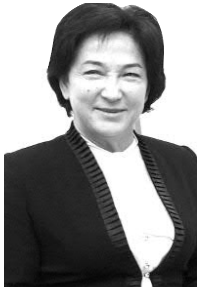
Қизилгул ҚОСИМОВА, Олий Мажлис Қонунчилик палатаси депутати, ЎЗХДП фракцияси аъзоси:

— Ҳаёт ўзгариб, ривожланиб борар экан, халқ ва давлат ўртасидаги муносабатларни тартибга солувчи қонунлар ҳам тақомиллашиб боради. Конституция ҳам шундай. 1992 йил яратилган, давлатимиз юзи, обрўси бўлган, миллий давлатимизнинг ривожланиши ва фуқароларнинг манфаатлари, уларнинг жамиятдаги ўрни, турмуш тарзини белгилаб берадиган Конституциямиз ҳам қанчалик мукамал бўлмасин, ҳаёт билан ҳамоҳанг равишда ислох этилишига эҳтиёж борлиги сезилапти. Шу кунларда барча ўз таклифи, фикр-мулоҳазаси билан фаол иштирок этмоқда. Зеро, барча ўзгаришларнинг ташаббускори ҳам, ижрочиси ҳам халқимиздир.