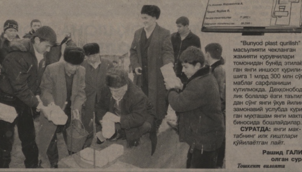
“Bunyod plast qurilish” massulyati cheklangan jamiyati quruvchilari tomonidan bunёд этилаётган янги иншоот қурилишига 1 млрд 300 млн сўм маблаг сарфланиши кутилмоқда. Деҳқонobod-лик болалар ёғи таътидан сўнг янги йилини замонавий услубда қурилган муҳташам янги мактаб биносиди бошлайдилар.

Янгийўл туманидаги Деҳқонobod қишлоғида жойлашган 18-ўрта таълим мактаби учун янги бино қурилиши бошланди.