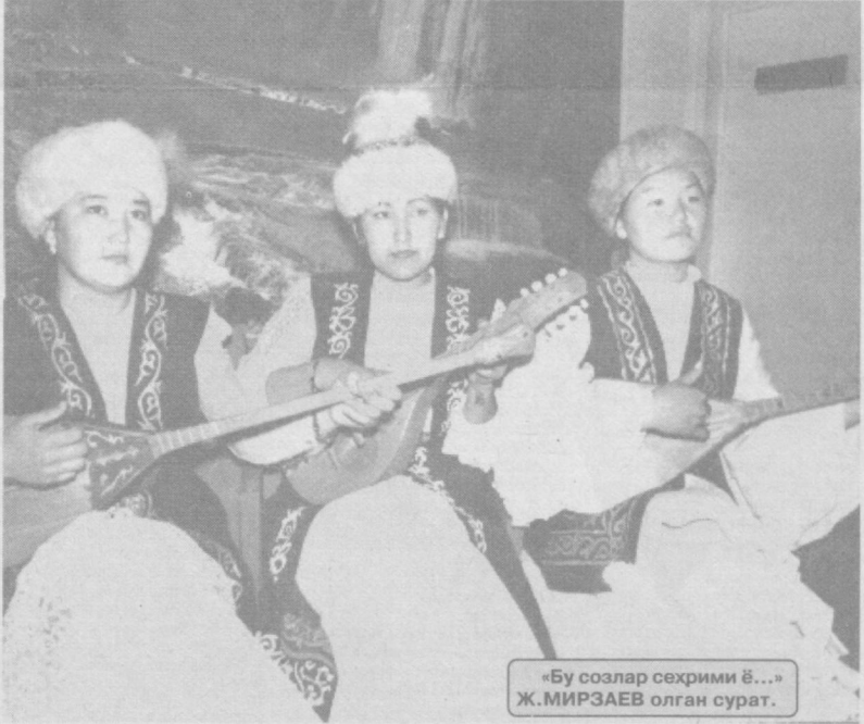
«Бу соғлар сеҳрими ё...»

Жума куни корхона- мида ҳисобат йиғили- ши бўлди. Унда ҳар га- гдай корхонамиз бош- лиғи Мели Қўчқорович эмас, бош муҳандиси- миз Изазаталаб Димо- дорович маъруза қи- ладиган бўлди.