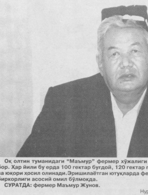
Оқ йили туманидаги "Маъмур" фермер хўжалиги жамоасининг 255 гектар ери бор. Хар йили бу ерда 100 гектар бугдой, 120 гектар пахта, 50 гектар беда экилади...

(Боши 1-бетда) Назаримда бу ишга шу юртининг фарзандиман, деган ҳар бири киши баҳоли қудрат хисса қўшиши керак.