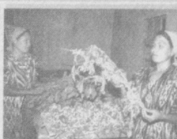
БАРГ ИЗЛАБ САРСОН БЎЛМАНГ (1-3-саҳифаларда)