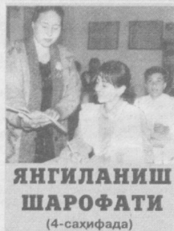
ЯНГИЛАНИШ ШАРОФАТИ (4-саҳифада)