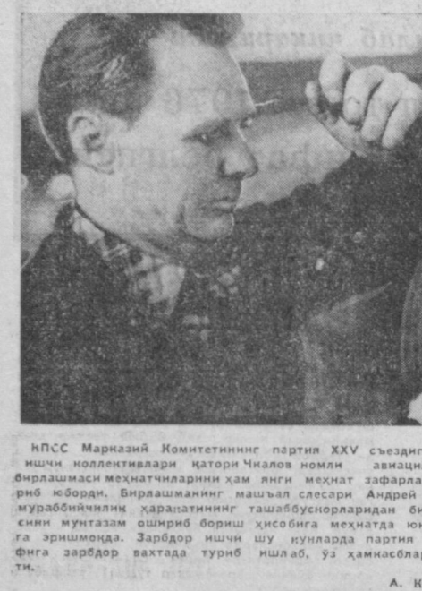
А. Кашанов фотоси.

КПСС Марказий Комитетининг партиямиз XXV сьезидига лойиҳаси умумхалқ муҳокамасида