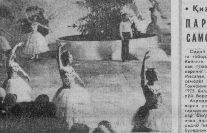
Укувчиларнинг қаниқул нумларда «Юбилей» спорт саройида муз устида кувноқ нарваал ўтмоқда.

лиқни гулханлар шивирли ту-дики ётган. Ланд уқдан махсус тазминли жири ушун салобат ва уағуворлик билан чиқиб келди.