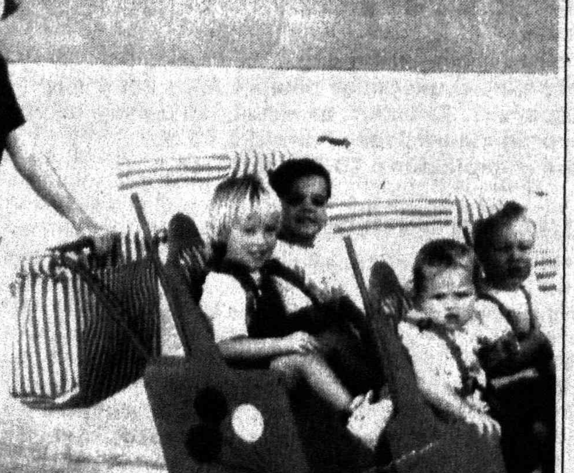
НА МИР ПОСМОТРЕТЬ И СЕбя ПОКАЗАТЬ.